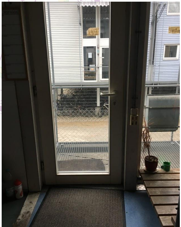
七人宿舍一樓模樣