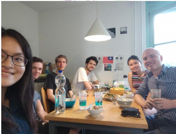
煮中餐和室友分享